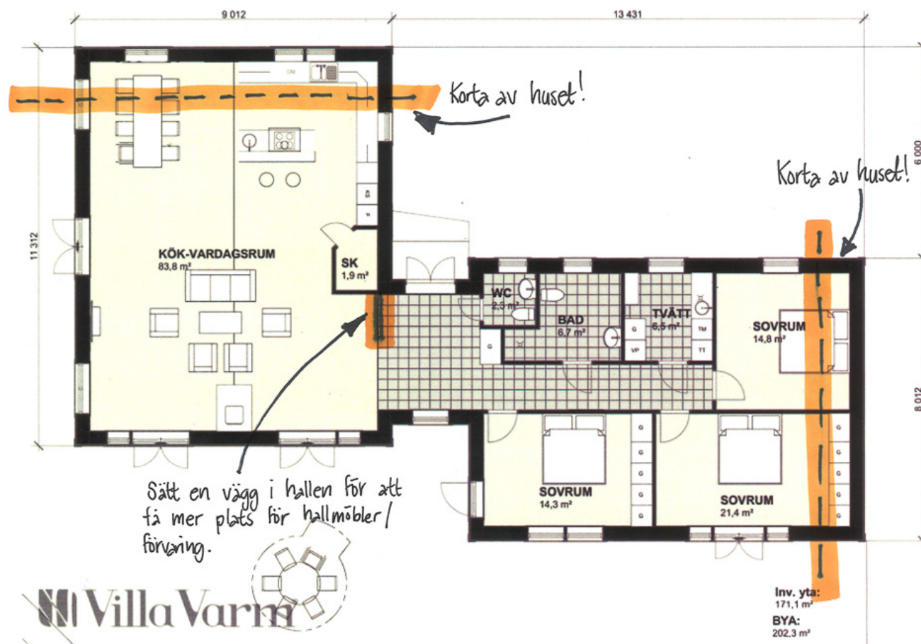
Ändring planlösning Villa Hestra